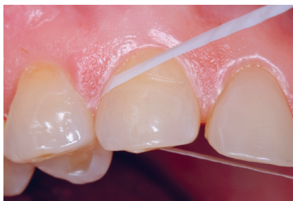
Figur 1. Et eksempel på tandtråd.