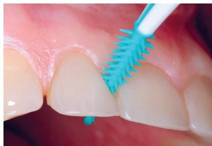
Figur 2. Eksempel på en tandstikker af silikone.