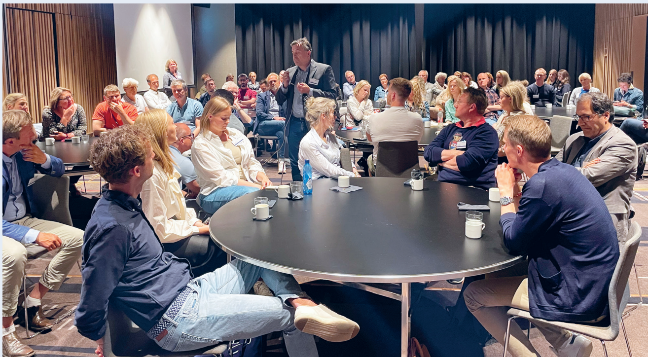
Det var mange og viktige diskusjoner under Forum for tillitsvalgte.

Verås Eriksen presenterte tall som viste at det i 2040 vil være rundt 450 000 flere over 65 år, samtidig som størstedelen av Norge vil få en nedgang i befolkning i yrkesaktiv alder. Det forventes også at de nasjonale inntektene vil avta grunnet avvikling av olje- og gassindustrien. Det vil si at det blir flere pleietrengende eldre, færre som kan ta vare på dem og trangere økonomiske kår for velferdsstaten. Dette er vanskelig å kombinere med den offensive utvidelsen av en universell offentlig finansiert og organisert tannhelsetjeneste som deler av venstresiden ønsker seg. For å lykkes med å utvide rettighetene og sikre at alle har et tilfredsstillende tannhelsetilbud må man få til et godt og regulert samarbeid med private aktører til pasientenes beste.