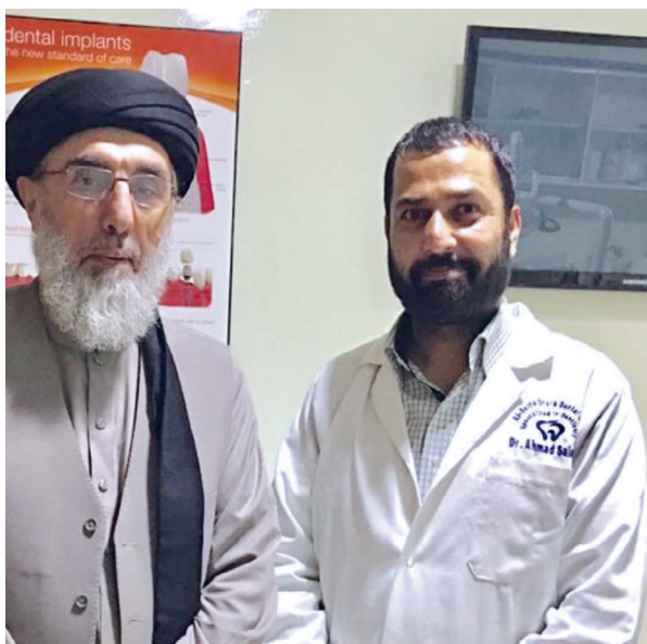
Gulbuddin Hekmatyar (t.v.) er både opprørsleder og politiker og har fortsatt innflytelse i Afghanistan. Tannlegesjefen i landet er stolt av å ha ham som pasient.

gruppe. Kalishnikovrifler og andre våpen var overalt. Hekmatyar var og er en berømt opprørsleder for mujahedin som kjempet mot Sovjetunionen og han var også beryktet for sitt mot og dessuten svært omstridt. Han ble senere politiker, og i en periode statsminister, i Afghanistan.