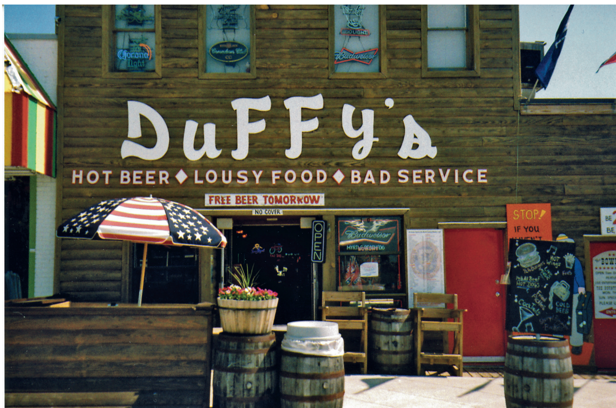
Det er andre muligheter enn strandliv i Myrtle Beach.

oppgangene og glaner. Den gang var de svært så påpasselige med å kontrollere mitt adgangstegn, men jeg teller nok ikke lenger. Der oppe i fjerde etasje satt jeg altså og skrev lærebok det året. Jeg føler meg ute av takt med virkeligheten og vil vekk.