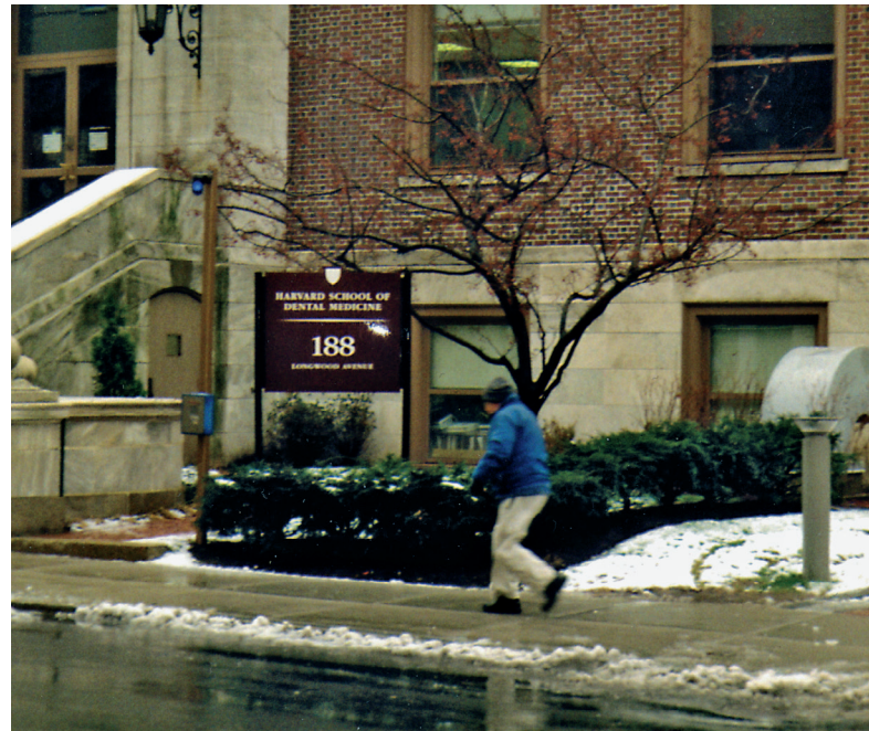
Det er surt og kaldt i Boston i april. Den gamle skolen er uforandret Harvard Square på Cambridgesiden av Charles river er symbolsentret for Harvard