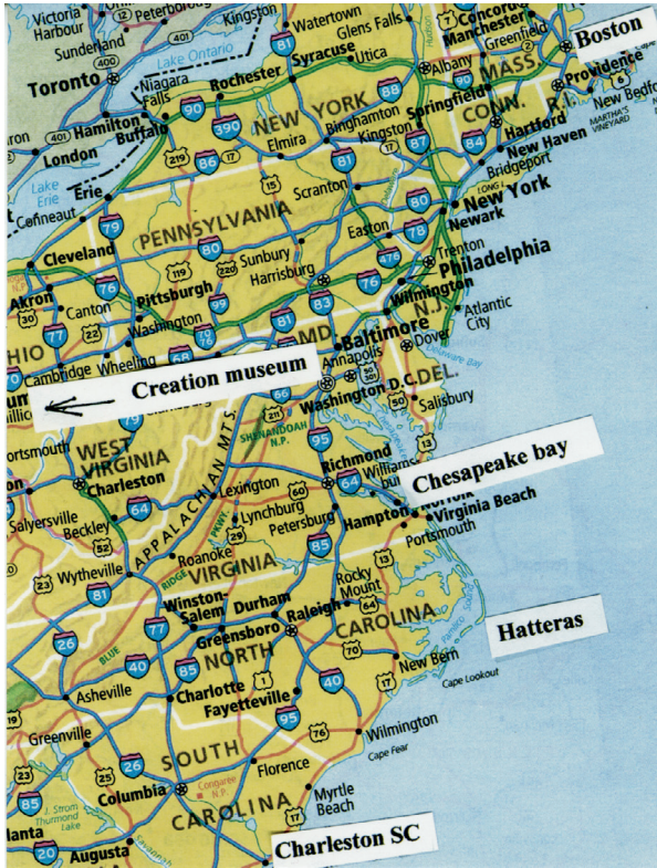
Oversikt over en del av USAs østkiert