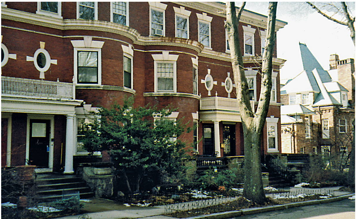
Boliggaten Salisbury Road er mer eksklusiv enn jeg husker den.