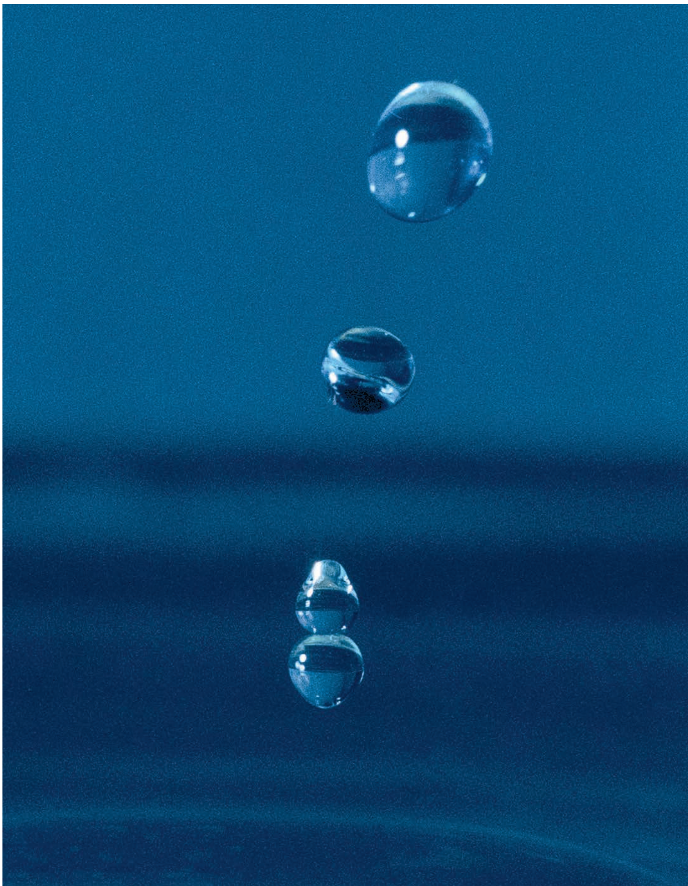
Blå dråper.