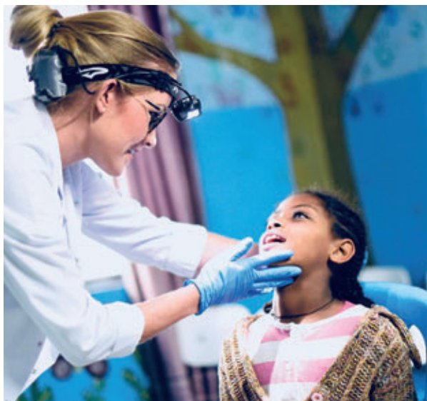
Screening og behandling av barn på barnehjemmet som vi samarbeider med.