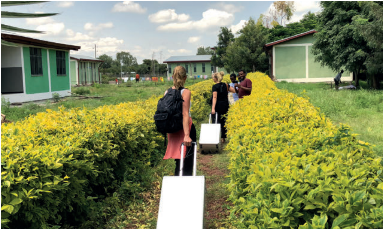
Tannhelsehjelp på to hjul, på vei mot det lokale sykehuset i Ziway.