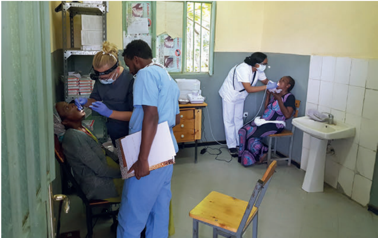
Feltarbeid på det lokale sykehuset i Ziway. Tett samarbeid med de lokale tannlegene.