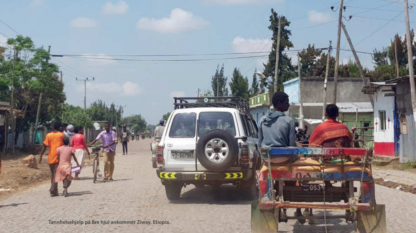
Tannhelsehjelp på fire hjul ankommer Ziway, Etiopia.

et team med ulik bakgrunn og forskjellige erfaringer. Vi skjønnte fort at å gjøre tannhelseteamet komplett med en tannhelsesekretær ville være både nødvendig og nyttig, og vi utvider derfor teamet tilsvarende ved de neste prosjektene slik at vi også har med tannhelsesekretærer. I år har vi med oss to tannhelsesekretærer som vil ha hovedansvar for å følge opp kryssinfeksjons-kontroll protokollene ved universitetsklinikken i Addis Abeba samt bidra til undervisning av studenter og lokale tannhelsesekretærer.