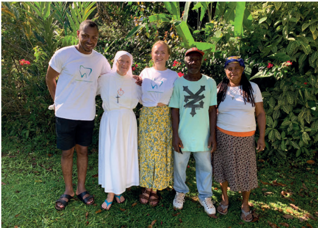
Tannhelse Uten Grenser samarbeider med blant annet «Holy Spirit Clinic» i fjellandsbyen Maggotty på Jamaica. Klinikken drives av nonner som har sykepleierutdannelse. Ved å samarbeide med «Holy Spirit Clinic» når TUG ut til mange. Når det blir kjent at det er tannhelsepersonell i landsbyen tar det ikke lang tid før det er kø utenfor klinikken.

med både utstyr, opplæring og pasientbehandling. Uten hjelp fra frivillige organisasjoner som TUG, har befolkningen ofte ikke noe annet valg enn å leve med tannsmertene eller å oppsøke selvlærte «gatetannleger» som igjen kan føre til livstruende post-operative infeksjoner og andre komplikasjoner.