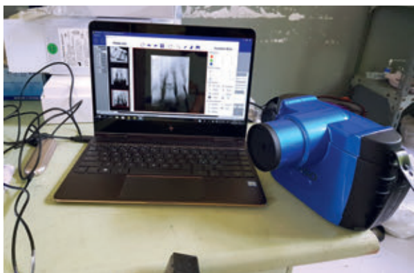
Med mobilt utstyr kan vi tilby moderne tannbehandling hvor som helst, så lenge vi har strøm tilgjengelig.

Under prosjektet i Etiopia i 2018 hadde vi også et stort fokus på kryssinfeksjonskontroll. Vi utarbeidet gode protokoller i samarbeid med universitetsklinikken i Addis Abeba (hovedstaden i Etiopia). Dette var mulig fordi vi var