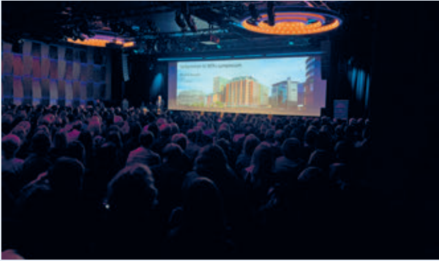
Full sal med over 650 deltagere.