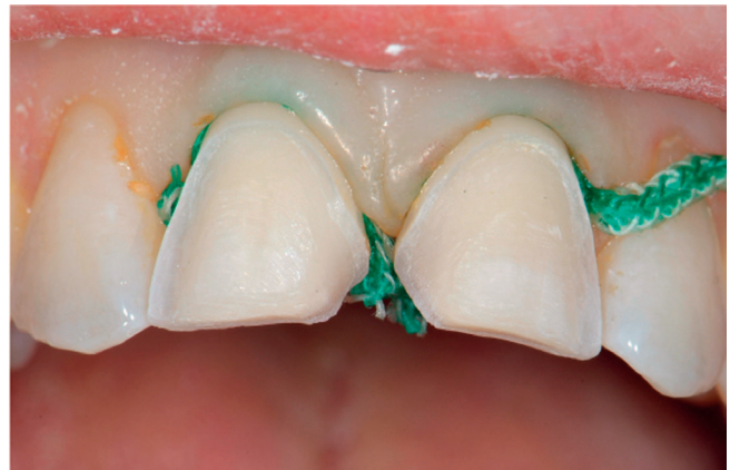
Figur 2. Preparation för skalfasader 11, 21 med preparationsgränserna som helhet förlagda i emalj. Breddning av tand vid diastemata förutsätter att kontaktpunkterna skärs (mesialt) medan anatomin distalt behålls oförändrad och de distala kontakterna därmed kan behållas intakta.

Porslin och glaskeramer har många likheter, men också en del viktiga skillnader att ta hänsyn till vid val av material. Båda grupperna innehåller kristallina faser i en matris av glas, men skiljer sig avseende materialens övergripande mikrostruktur, kristallernas typ och storlek, vilket väsentligen påverkar materialegenskaperna. (Tabell 1)