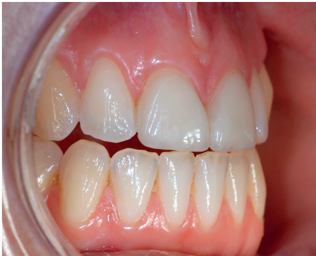
Figur 1. Skalfasader 11, 21 framställda i porslin bränt på brännstans.

Porslin och glaskeramer är de dentala keramer som erbjuder bäst möjligheter att efterlikna naturlig tandsubstans. Goda optiska egenskaper innebär emellertid oftast att de mekaniska egenskaperna är sämre eftersom ett materials translucens oftast kommer till priset av lägre hållfasthet och seghet.