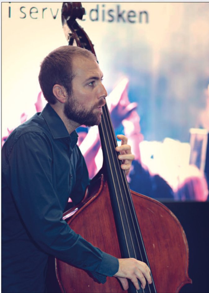
Trafalgar er en trio med saksofon, kontra- bass og trommer, som bidro med nydelig musikk gjennom hele landsmøtet.