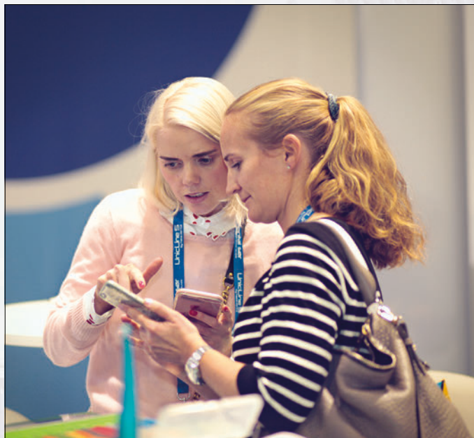
Fra Nordental.