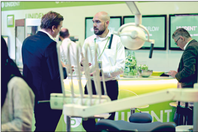
Fra Nordental.