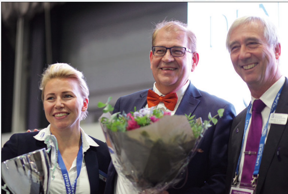
Oral B mottok prisen for beste stand på Nordental 2017, mens Jacobsen dental og Dental Sør fikk hederlig omtale.

I juryens omtale av vinnerstanden heter det blant annet: Standens utforming og dekor reflekterer merkevaren og produktene på en fin og kreativ måte. Personalet fremstår som imøtekommende og faglig dyktige. Standen er godt synlig, innbydende og lett tilgjengelig. Prisen ble overrakt av NTFs generalsekretær Morten Rolstad (t.h.).