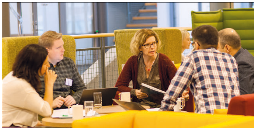
Deltakerne på Lønnspolitisk forum arbeidet i grupper begge dagene for å utarbeide en best mulig pensjonspolitik for NTF.

Før vedtaket om sammenslåing ble det gjort en grundig innbyggerundersøkelse, som så ble diskutert på et felles