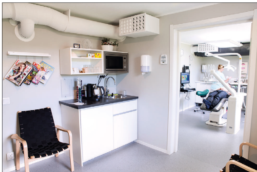
Venterommet ved grenseklinikken i Tärnaby.