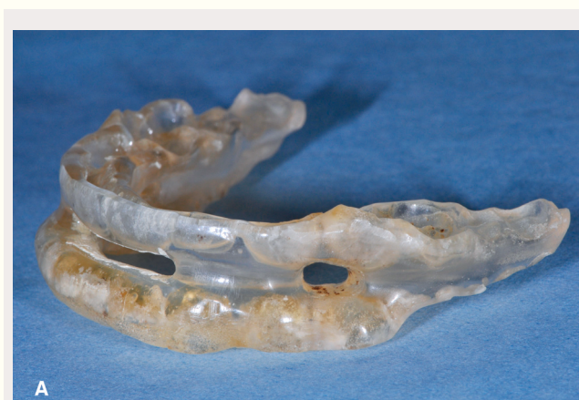
Figur 1A. Velbrukt monobloc søvnapnéskinne.

En søvnapnéskinne fungerer ved at mandibelen forskyves fremover og samtidig trekker med seg tungen til en relativt stabil protrudert posisjon. Derved økes volumet i de øvre luftveiene særlig ved lateral utvidelse i velopharynx (28). Skinnens konstruksjon forhindrer underkjeven i å sige bakover når pasienten sover, spesielt i ryggleie, og på den måten holdes de øvre luftvei-