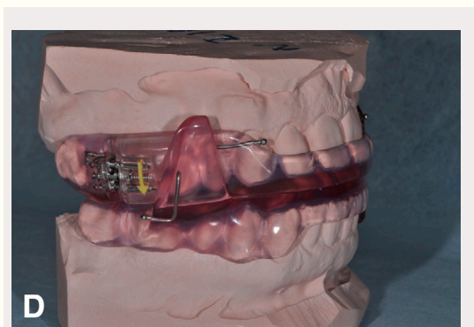
Figur 1D. SomnoDent® søvnapnéskinne.