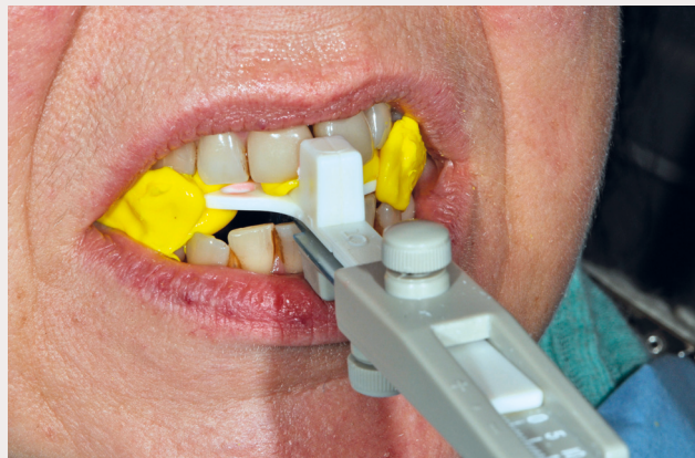
Figur 3. Protrusjonsregistrering ved hjelp av George Gauge™.

protrusjon, det vil si jo større den mandibulære protrusjonen er, alltid målt i forhold til pasientens maksimale protrusjonsevne, desto mer vil AHI-indeks reduseres og normaliseres (33).