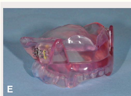
Figur 1E. SomnoDent EDENT® søvnapnéskinne for tannløs overkjeve.

ene åpne gjennom natten. Man skal imidlertid være klar over at ikke alle pasienter responderer like effektivt.