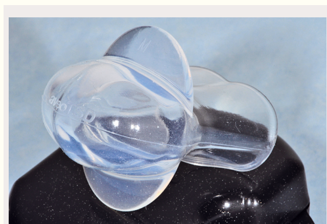
Figur 2. AveoTSD® tungeholder mot søvnapné ved total tannløshet.

Det finnes et rikt utvalg av forskjellige skinnelvarianter på markedet (figur 1A–E). Materialet skinnene er laget av, skinnkonstruksjon, protrusjonsmekanisme, grad av vertikal åpning og lateral bevegelsesfrihet er blant de faktorer som varierer. Studier har vist at design kan påvirke behandlingseffekt og pasienttoleranse (29, 30). De to viktigste hovedgrupper av søvnapnéskinner er henholdsvis mono- og bibloc-skinner.