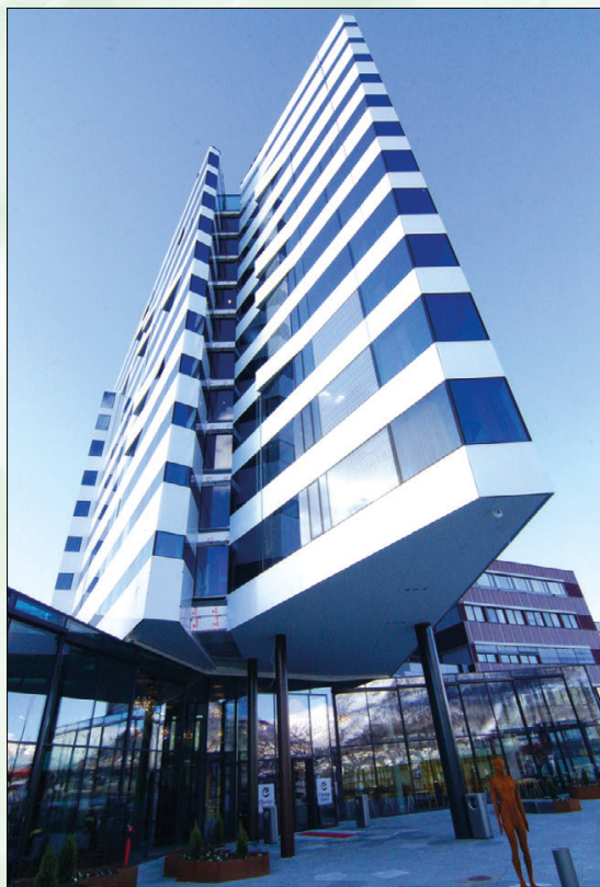
Clarion Hotel The Edge, Tromsø.

Kurset teller fem timer i NTFs etterutdanningssystem.