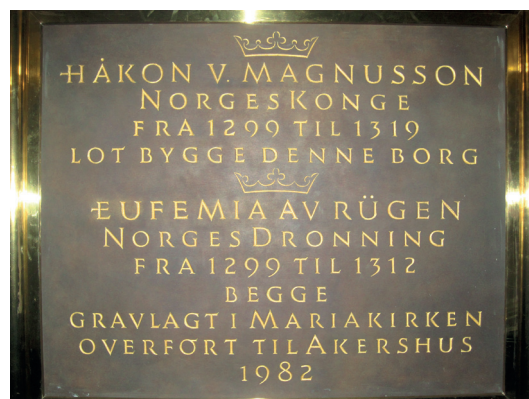
Dronning Eufemia og kong Håkon 5. ble gravlagt i Mariakirken i 1319 og overført til Akershus festning i 1982.