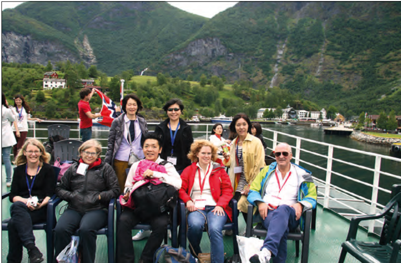
På Nærøfjord i fantastisk vær med deltakere fra en rekke land (USA, Japan, Sverige og Taiwan).