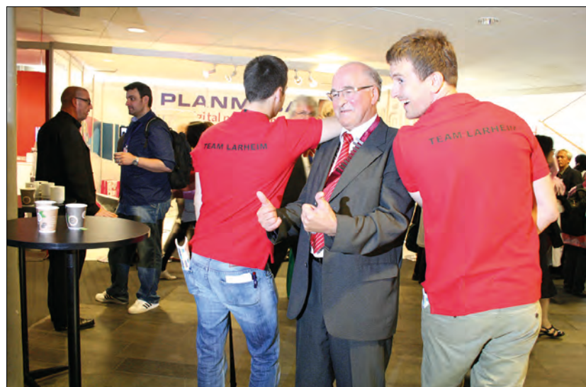
Studenter og annet staff gikk i røde pirquet skjorter.