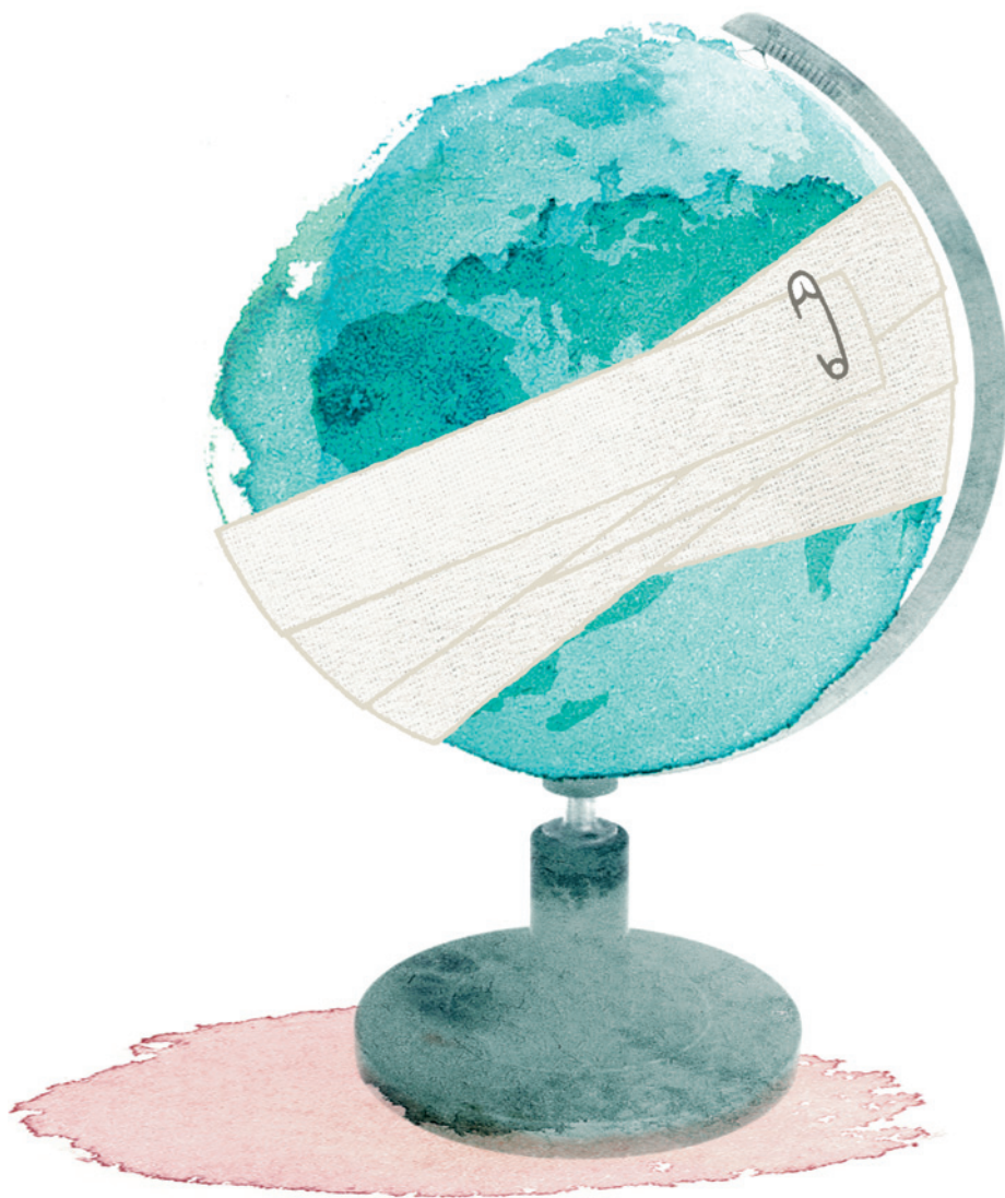
Illustrasjon © Supernøtt popsløyd

Norges utenriksminister, Jonas Gahr Støre, har tatt til orde for at helse bør få større plass i utformingen av utenrikspolitikk og globale styringsprosesser. I Oslo-deklarasjonen fra 2007 uttrykker utenriksministre fra Brasil, Indonesia, Sør-Afrika, Thailand,