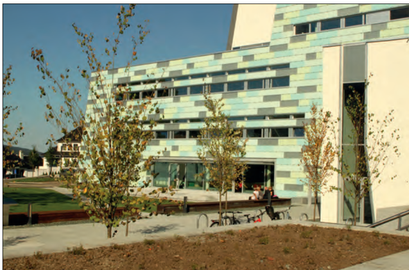
Fasaden til Europas mest moderne odontologibygge er dekket med blå, grå og turkise plater.