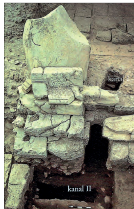
Kanaler. Avløpskanalene der funnene ble gjort.

VAKKERT TEMPEL • Castor og Pollux-templet ble oppført allerede i år 484 før vår tidsregning, men ombygget flere ganger. Det var et vakkert byggverk med en søylegang av marmor i korintisk stil. De tempelrestene vi ser i dag, stammer vesentlig fra en ombygging under keiser Augustus i år 6. I den ene kortenden hadde templet et sju meter høyt podium med forhall, kultrom og søylehall. Forum Romanum var Romerrikets politiske sentrum, og børs- og bankfolk holdt til i noen av rommene