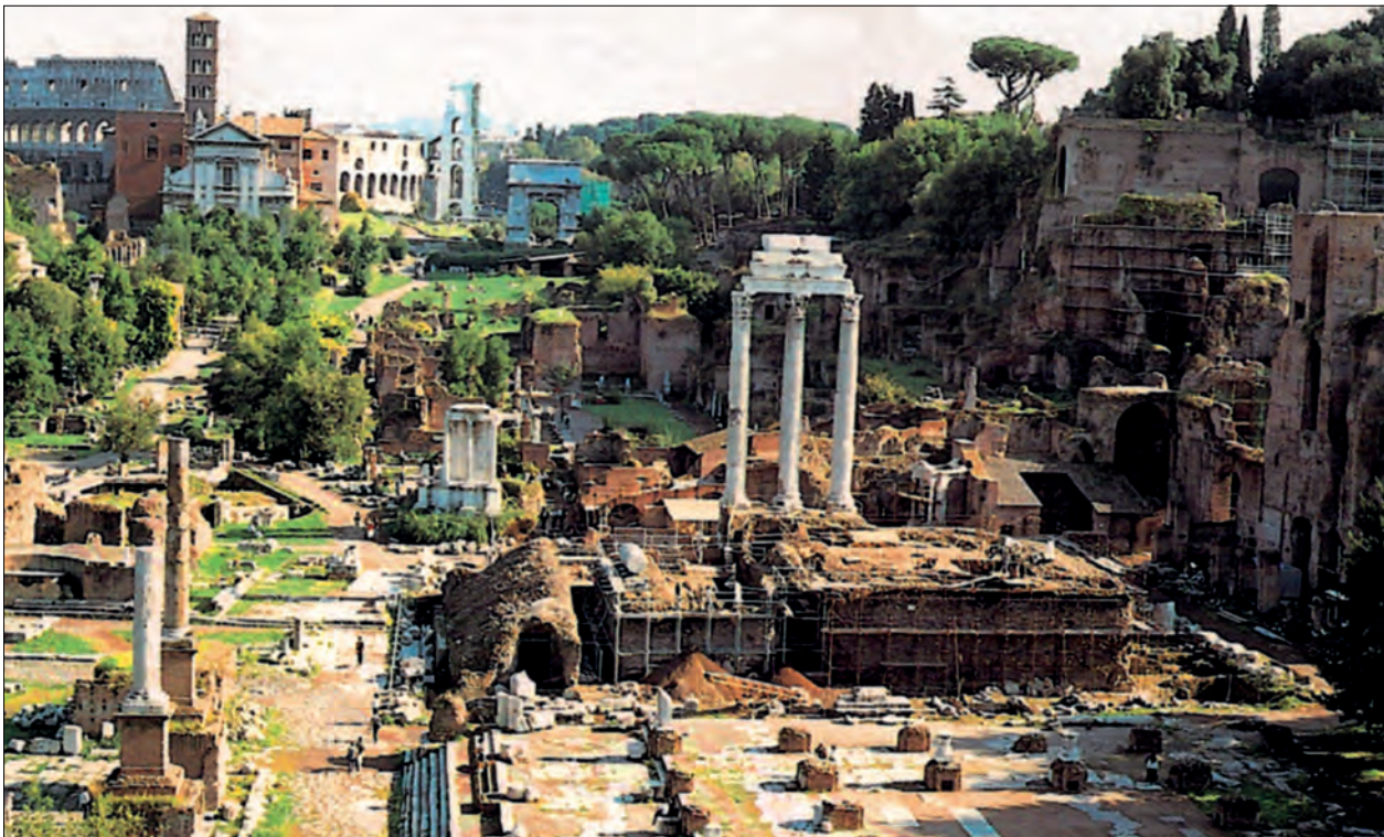
Castor og Pollux-templet under utgravingsperioden.