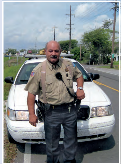
Sheriffen har tatt meg for speeding, men stiller vennlig opp som fotoobjekt.

Men det andre forslaget er topp. Etter en sving inn i landet, der kuer (!) dominerer utelivet, kommer jeg på en bygdevei langs en ti mil lang «bayou» med småtrålere og alskens virksomhet forbundet med vann og sjø, og til slutt et uendelig område av flate øyer og høye broer mot havet helt nede på sydspissen. Der det hele ender i en velholdt park, der folk kan rekreere seg på mange forskjellige vis; men nå er det stille og utenom sesongen. Alle bygningene her ble feid ned av Katrina, sier damen i luken, men er nå bygget opp igjen. Utsiktstårnet gir god utsikt mot havet og båttrafikken som betjener oljeinstallasjonene lenger ute. Og her finns rikelig med informasjon om økologien og om de første europeiske innvandrerne i dette området. Det er dårlig med moteller i nærheten, så jeg må tilbake igjen for å overnatte, men det gjør ingen ting. Også tilbaketuren er idyllisk langs bayouen.