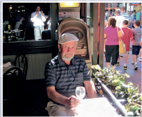
Kelneren på «Bayou» har plassert meg ved vinduet. Man ser ham selv i speilet.

tegrer smaken på mange matretter i dette området, var opprinnelig betegnelsen på fransk-kanadiere (acadiens) som flyktet fra engelskmennene og slo seg ned i sumpområdene i det sørlige Louisiana. De tok med seg sin egen matkultur og skjøt på med ingredienser fra det lokale området.