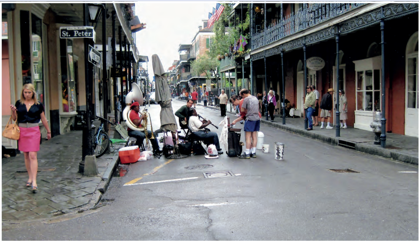
Du skal ikke langt innover Bourbon Street før du treffer på et jazzband.