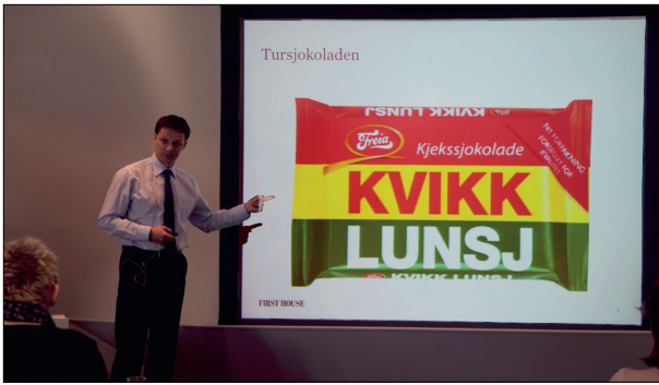
Hvorfor får vi et bilde i hodet av Kvikk Lunsj når vi sier tursjokolade? var et av dagens spørsmål.