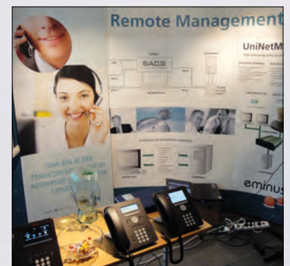
Mitec Group as.