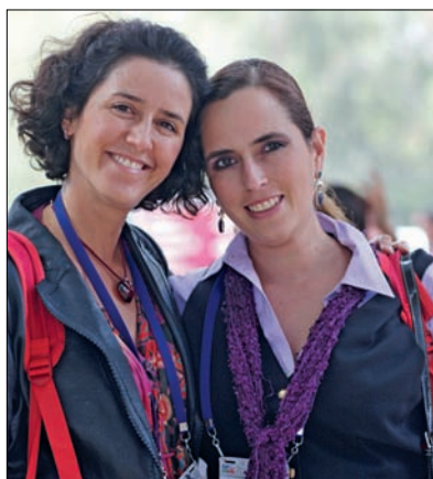
To fornøyde mexicanske tannleger.

– Dette går fra å være såpeopera til å bli en skrekkfilm, sa et rystet rådsmed-