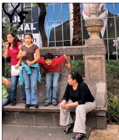
Folkeliv i Mexico city.