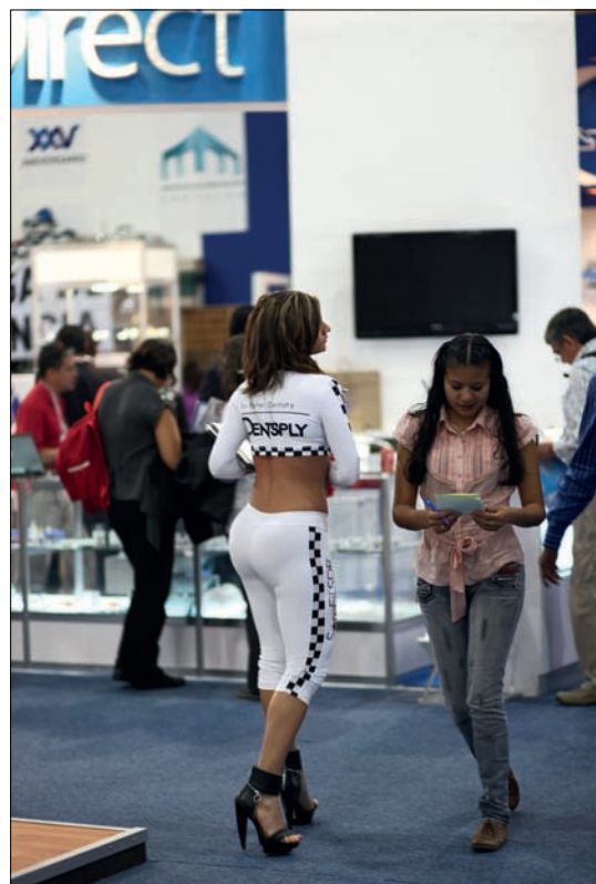
Utstillingen var godt besøkt og stor. Her er en av Dentsplys representanter, kledd på en måte som kanskje ikke ville gått helt hjem i Norge.