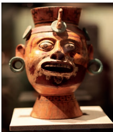
800 år gammel aztekisk oljekrukke.