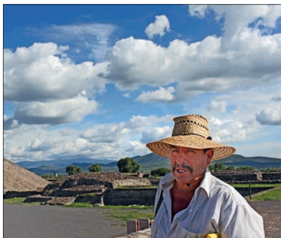
Mexico har verdens nest høyeste pyramide og slående vakker natur.