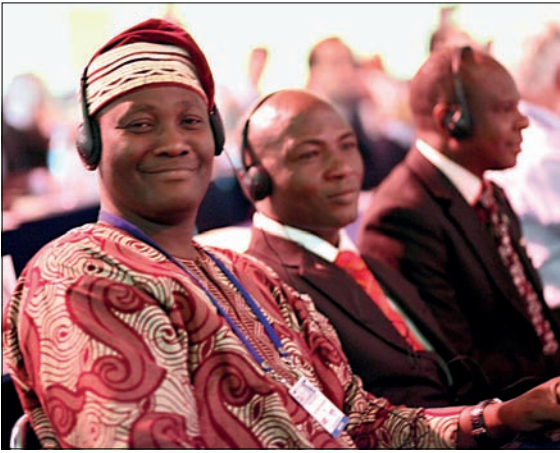
Landene på N satt på samme rekke. Her er Norges naboer fra Nigeria.

Mange talere tok til orde for større transparens og mer kontroll, deriblant Jørgensen.