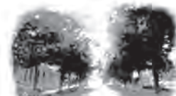
Bygdøy Allé Tannestetiske Senter Bygdøy Allé 5, 2. etasje, 0257 Oslo

Lyst til å prøve deg på å behandle pasienter i narkose/sedasjon – eller å henvise pasienter? Det praktiske avtaler du med Olaug Egeland som er å treffe på TELEFON: 22 44 15 35 og 900 43 020 E-POST: narkose@tannleger.com