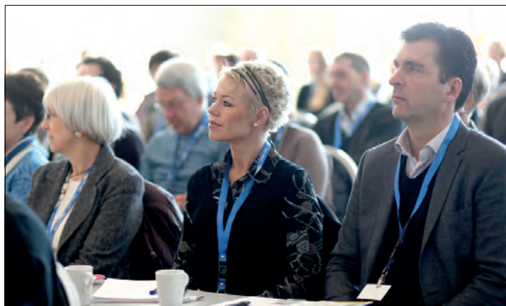
En fullsatt sal ved åpningen av Midt-Norgemøtet.