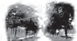
Bygdøy Allé Tannestetiske Senter Bygdøy Allé 5, 2. etasje, 0257 Oslo

Lyst til å prøve deg på å behandle pasienter i narkose/sedasjon – eller å henvise pasienter? Det praktiske avtaler du med Olaug Egeland som er å treffe på TELEFON: 22 44 15 35 og 900 43 020 E-POST: narkose@tannleger.com