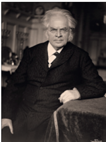
Bjørnstjerne Bjørnson, fotografert på Villa Sole, Slemdal 1908.

»...Jeg gaar her og skriver Dikte og stiller med et nyt Stykke. Og er en og anden Dag syg af Dreyfussagen, det eneste, som forstyrrer mig. Det herligste Vejr! Hver Dag to Timers Tur i Skogen, helst paa den Vej, som bærer mit Navn. Alle mennesker, høj og lav, hilser os og prater med os, straks vi stikker Næsen ud. De