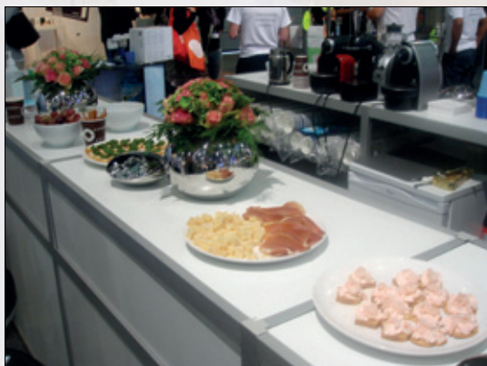
Dentalcare med flere bød på gode saker, pent anrettet.

Dentalcare/Dental spar/Online depots hadde lagt seg i selen. Pent og delikat anrettet bød man på parmaskinke og parmesanost, pesto, rekesalat og brie. Det ble skjenket Bris, brus og kaffe av de meget hyggelige damene på standen. Her var det fristende å slå seg til, for dette var førsteklases. Terningkast 6.