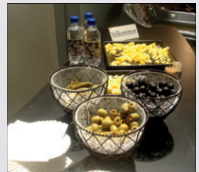
Norsk Ortoform bød på ost fra Hemsedal, med mer.

Lic/Scadenta/Interdental hadde en hyggelig stand med glade servitører som i tillegg til god drikke bød på fenalår fra Tromsø og rakfisk i lefse med «tata» (en soyasaus). Meget velsmakende. Her var det hyggelig å ta en liten pause på vår vandring rundt på Nordental. Terningkast 5