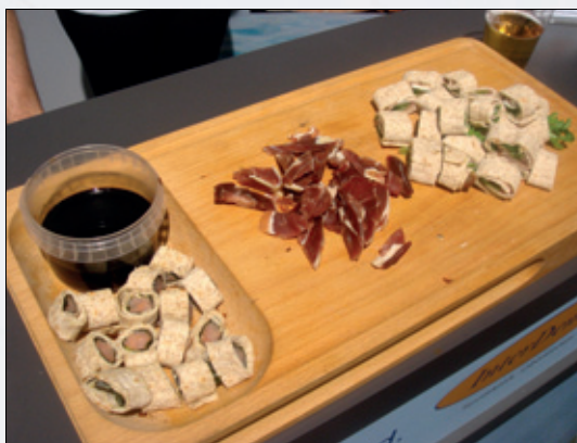
Lic/Scadenta/Interdental serverte fenaår, og rakkfisk i lefse.

Artinorway var i år i stjerneklassen. En flott stand med hyggelige og oppmerksomme mennesker. Serveringen var upåklagelig. Det var rikelig med sushi; laks, scampi, ingefær og soya. Lekkert servert. Også tørsten lot seg slukke hos Artinorway, og personalet på standen etterkom de fleste ønsker i så måte. Dette var virkelig bra! Ter-ningkast 6