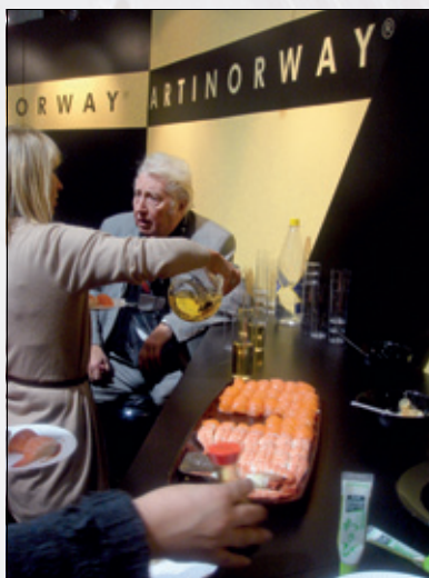
Artinorway satset på sushi i år. Stjerne-klases sådan.

og velsmakende tapas i store mengder helt på slutten av dagen (kl 17), med dertil hørende rød og hvit vin. Dette er en hyggelig tradisjon, og mange vet om det, og er på plass når serveringen starter. Knoll og Tott var også på plass.