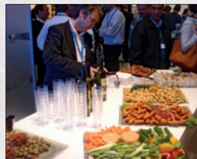
Norsk Dental Depot hadde rikelig og ventet mange gjester til vin og tapas fra kl. 17.00.

og velsmakende tapas i store mengder helt på slutten av dagen (kl 17), med dertil hørende rød og hvit vin. Dette er en hyggelig tradisjon, og mange vet om det, og er på plass når serveringen starter. Knoll og Tott var også på plass.