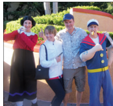
Fra Disneyworld i Orlando. NTFs lokalforeningsleder er nummer. tre fra venstre.

Andre del er altså fra andre del av forrige århundre, og beskriver oppveksten til hovedpersonen i denne andre delen av romanen. Det foregår i Oslo, og det er mange episoder som gir grunn til ettertanke, samtidig som mange episoder er skrevet med et glimt