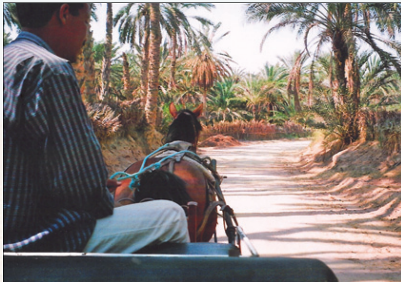
Hest og kjerre er det beste transportmidlet i oasen.

INN I OASEN • Vi leier oss en hest med vogn og kusk for å ta en kjøretur