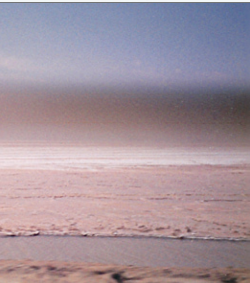
Den store saltsjøen virker uendelig stor og ugjestmild.

byggere i Nefta, men ingen bor inne i selve palmelundene.