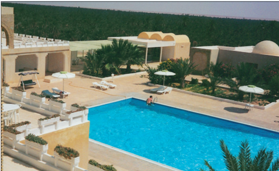
Svømmebassenget på Hotel la Rose Nefta var deilig svalende i 40 graders varme. Den tette skogen bakenfor er palmer.

i Tunisia oppblandet med pre-islamisk tradisjon fra berberkulturen. Sufismen begynte som en inderliggjørelse av islam via bønner, gudshengivenhet og forsakelse med vekt på frykt for Allahs dom. Navnet har sufismen fra det arabiske ordet suf som betyr ull og er betegnelsen på den enkle ullkappen som de første islamske asketene bar.