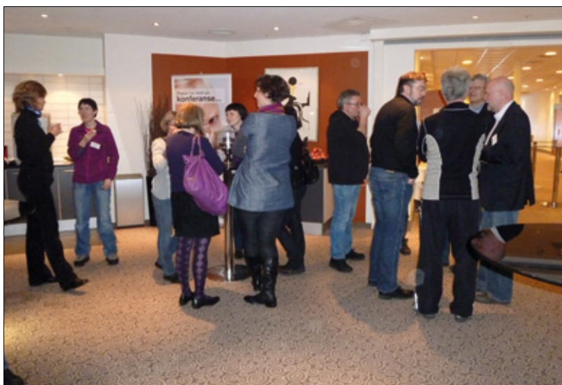
Pauseprat er ofte like viktig som selve møtet.