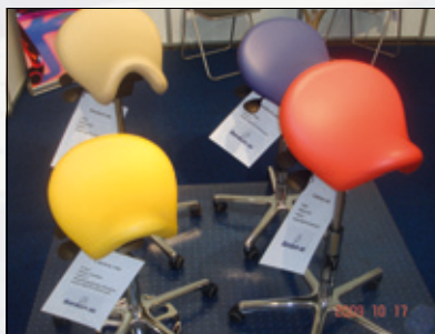
Sessler fra Bardum.

W&H Nordic bød på en ny generasjon ultralydverktøy til scaling som de beskjedent markedsfører under betegnelsen NO PAIN. Den sveitsiske produsenten EMS har minst 25 år på baken