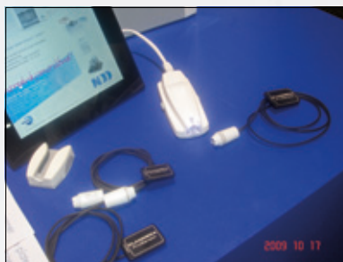
Norsk Dental Depot.

Planmecas nye røntgensensorer var smekre enn tidligere og koblingen til kontrollboksen skjer nå magnetisk.