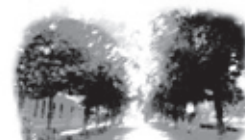
Bygdøy Allé Tannestetiske Senter Bygdøy Allé 5, 2. etasje, 0257 Oslo

Lyst til å prøve deg på å behandle pasienter i narkose/sedasjon – eller å henvise pasienter? Det praktiske avtaler du med Olaug Egeland som er å treffe på TELEFON: 22 44 15 35 og 900 43 020 E-POST: narkose@tannleger.com