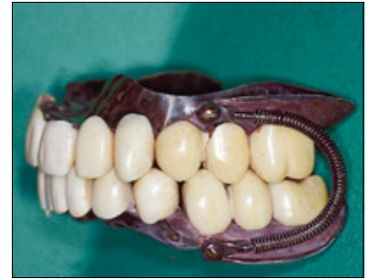
Jacob Aall-Moes eksamensarbeid fra 1862.

– Som du ser er kontoret plassert midt i tannlegens egen stue. Tråbore-