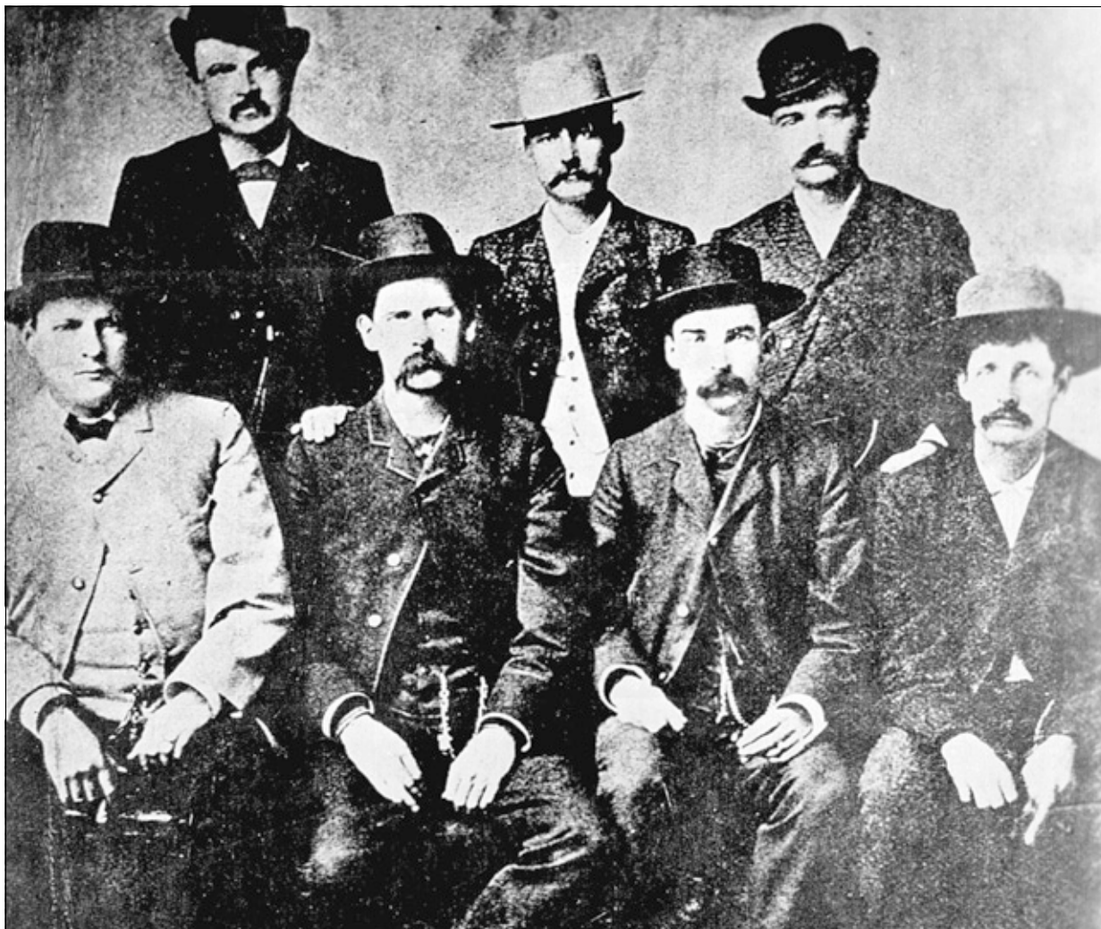
Wyatt Earp og revolvergjengen.

kniv i brystlomma. Disse ble han fort kjent for å være svært dyktige med. Tre revolverkamper kjenner man til innenfor et kort tidsrom i Dallas, og den ene endte med motstanderens død. I det Dallas var en del av det temmelig ville vesten, så ble det ingen juridiske konsekvenser av dette. Sommeren 1876 var han imidlertid i en ny revolverkamp og denne gangen drepte han en soldat. Det bragte United States Government på banen og Doc var snart på rømmen vestover. I hans spor fulgte nå US Army, US Marshals, Texas Rangers og lokale lovmenn, og alle var ute etter belønningen som var satt på hans hode. Doc visste at om han ble tatt så ville han ende i nærmeste galge, så han sadlet sin hest og red rett ut i apache-land, med retning mot Colorado. Før han nådde Denver var