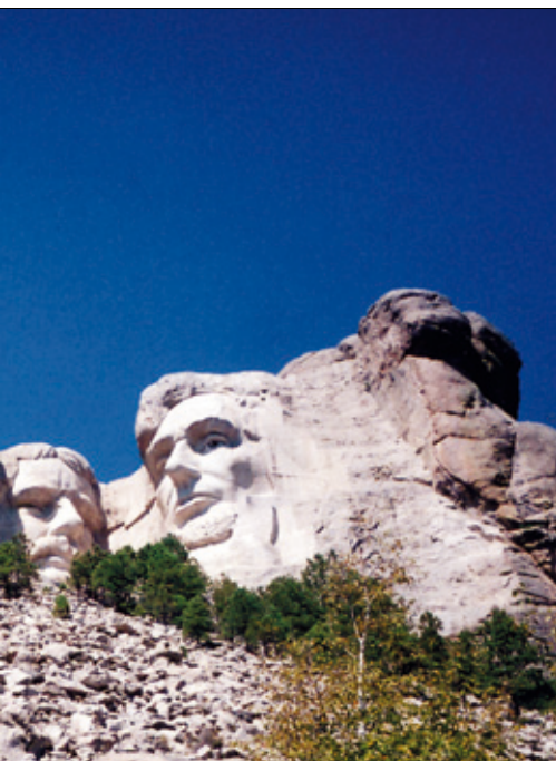
Mount Rushmore med ansiktene til presidentene Washington, Jefferson, Roosevelt og Lincoln.

men du kan få den servert som «buffaloburger». «Buffalo» ble en vanlig betegnelse på bisonen, selv om egentlige bøfler ikke fantes i den nye verden.