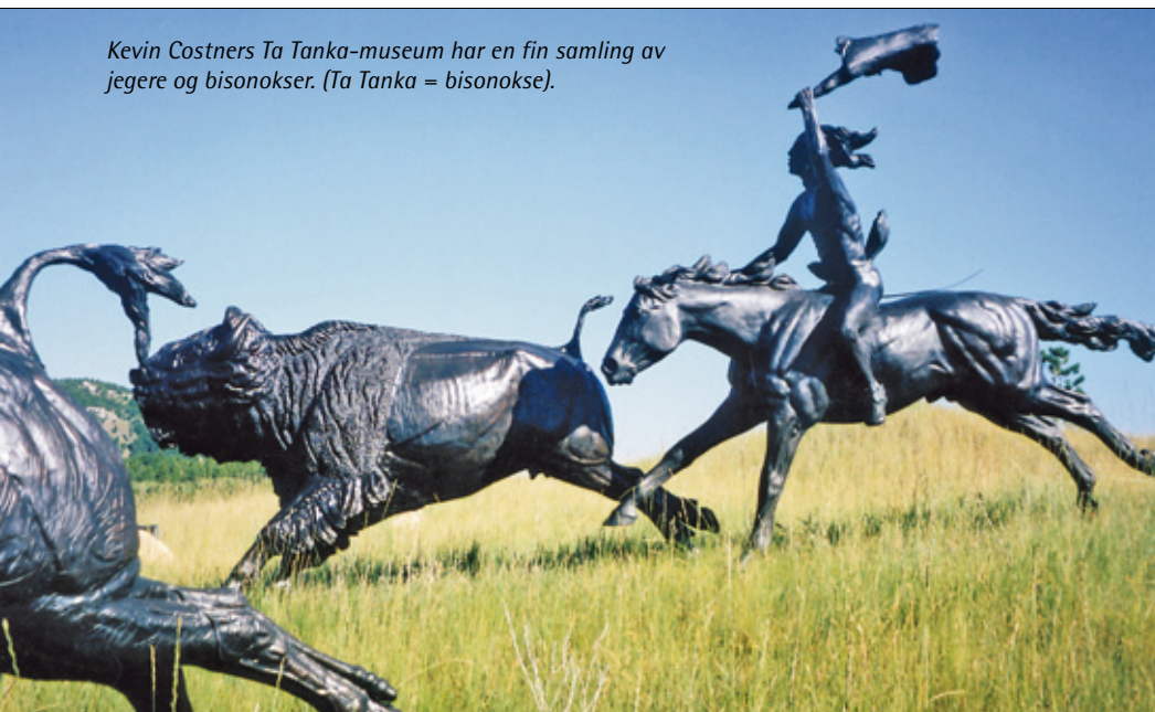
Kevin Costners Ta Tanka-museum har en fin samling av jegere og bisonokser. (Ta Tanka = bisonokse).

(«BISONOKSE») • Oppe i fjellene lenger vest i South Dakota finner jeg Kevin Costners Ta Tanka, et lite museum der temaet nettopp er bisonens historiske betydning. Hans film «Danser med ulver» ble tatt opp i denne staten. I friluft samme sted finnes digre skulpturer av bisoner og jegere, mens Costner selv sitter inne og forteller om bakgrunnen – på video. Indianerne hadde opprinnelig en viss kontroll med bisonen, men så satte europeernes pelsjakt og brucellose inn, og bisonen forsvant. I dag finnes bison bare i de store nasjonalparkene eller som oppdrettsdyr,