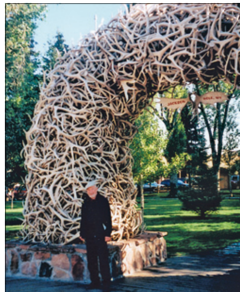
Alle fire inngangene til byparken i Jackson Hole er laget av gevirer.

Bare frimerker har normale priser, men ved å sprengje budsjettet en smule kan jeg utforske byen fra en motellsuite midt i sentrum. Som svoren proletar og praktiserende antimaterialist må jeg jo skaffe meg rede på hvordan kapitalistene har det, ikke sant? Og de