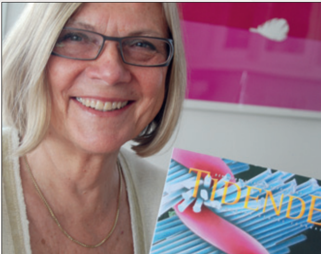
– Jeg har hele tiden vært opptatt av at forsiden skal være vakre og relevante og at hele bladet skal gi leserne en god følelse og lyst til lese.

– Noen helt store konflikter har det vel ikke vært, selv om jeg nok har måttet «stå på krava» ved enkelte anledninger. I 1990 hadde en tannlege en serie helsides annonser med hvilke tilbud han hadde i sin praksis, og det var ikke populært den gangen. Da måtte vi hente juridisk bistand utenfra for å få aksept for at også annonsers budskap og utforming er redaktørens ansvar. En del lesere trodde dessuten at hovedstyret eller generalsekretæren skulle godkjenne alt som står i Tidende og at det derfor ikke nyttet å komme med kritikk. Det stemte altså ikke, og dette er ikke noe problem i dag, sier Sangnes. For Tidendes lesere kan debatten bli tidvis frisk nok. Dette er en funk-