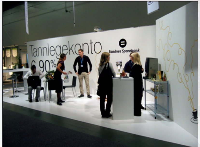
Figur 12. Beste stand.

Tekst: Kjetil Reppen