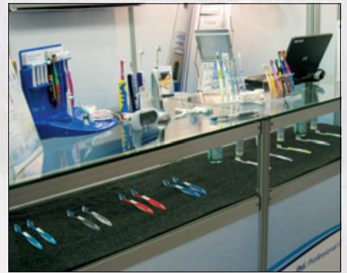
Figur 10. Litt av utvalget fra Oral B.

sjon. NTF hadde som alltid sin informasjonsstand, og det samme hadde NAV. Og NAVs tilstedeværelse på Nordental var ekstra viktig i år, siden vi har fått nye trygderegler. Noen fylkeskommuner (Finnmark og Hedmark) benyttet også Nordental til å eksponere seg og kanskje rekruttere flere tannleger til sine deler av landet. (Figur 13, 14).