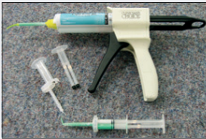
Figur 8. Avtrykksprøyte fra Norsk Ortoform.