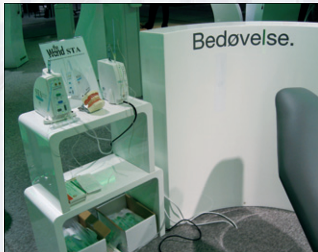
Figur 5. Wand STA computerstyrt anestesi.

viste også frem Microlux, som er en trådløs, sterk lyskilde med svært tynn lysleder. Den er med sitt skarpe, skyggefrie lys velegnet til å finne infraksjoner og karies, og den er helt sikkert et hjelpemiddel mange vil kunne ha glede av på jakt etter flere kanaler i endosammenheng (Figur 9).