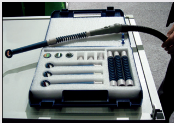
Figur 7. Mirrodent fra LIC.