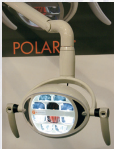
Figur 4. Operasjonslampe fra Dentalservice.