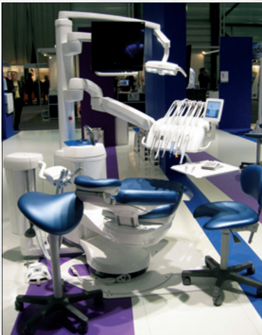
Figur 1. Planmecas nyeste unit.