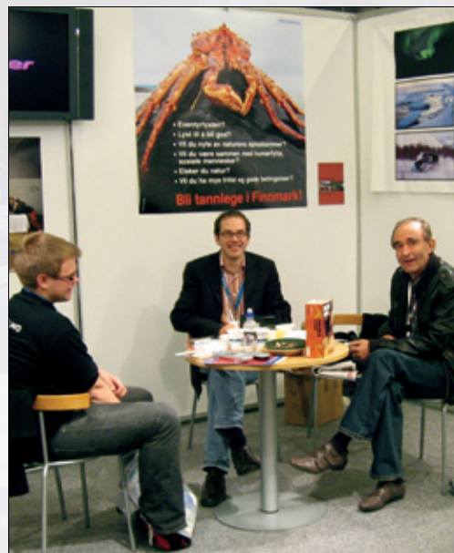
Figur 13. Finnmark fylkeskommunes stand.