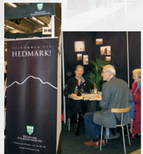
Figur 14. Hedmark fylkeskommune deltok også.