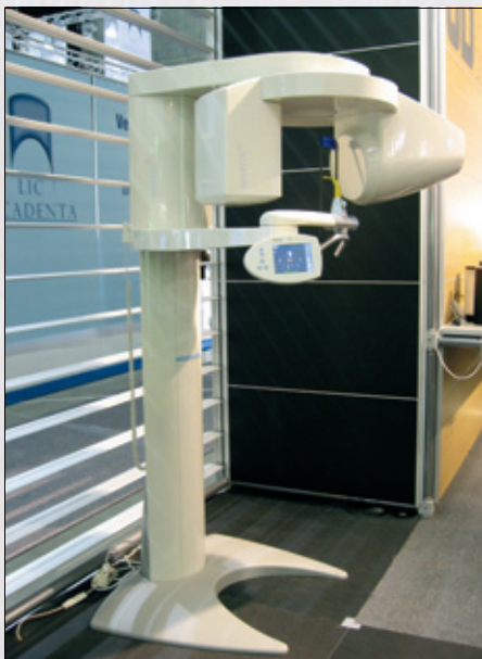
Figur 3. Sironas 3D OPG.