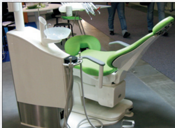
Figur 2. Hekas designunit.