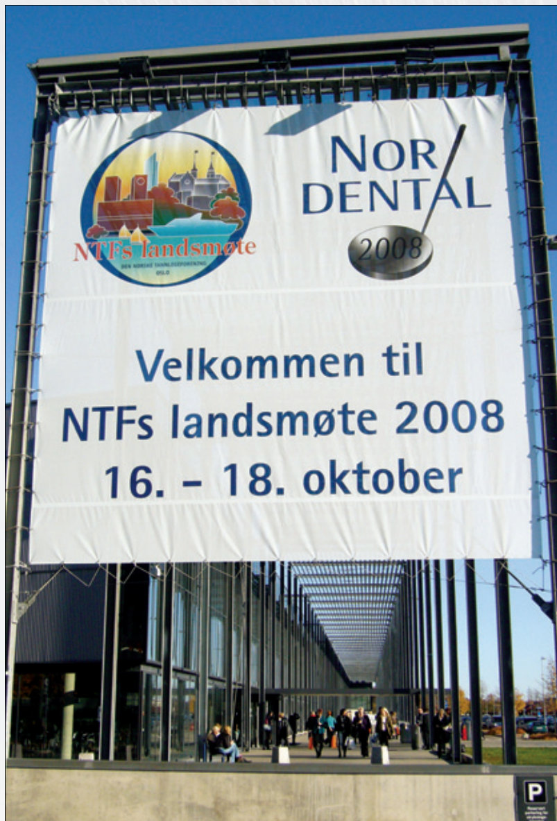
NTFs landsmøte 2008 fant sted i Norges varmemesse på Lillestrøm.

N TFs landsmøte og Nordental har nesten aldri samlet flere deltakere. 3 610 personer fant veien til Norges Varemesse på Lillestrøm i dagene 16.-18. oktober. 1 030 besøkte bare utstillingen, som dekket 3 336 netto kvadratmeter. Arealmessig en ny rekord. I tillegg kommer vel 220 utstillere og 330 deltakere på NTFs forkurs onsdag 15. oktober. Med andre ord, nesten 2 600 tannleger, inkludert studenter, tannteknikere, tannpleiere og tannhelsesekretærer var påmeldt hele arrangementet.