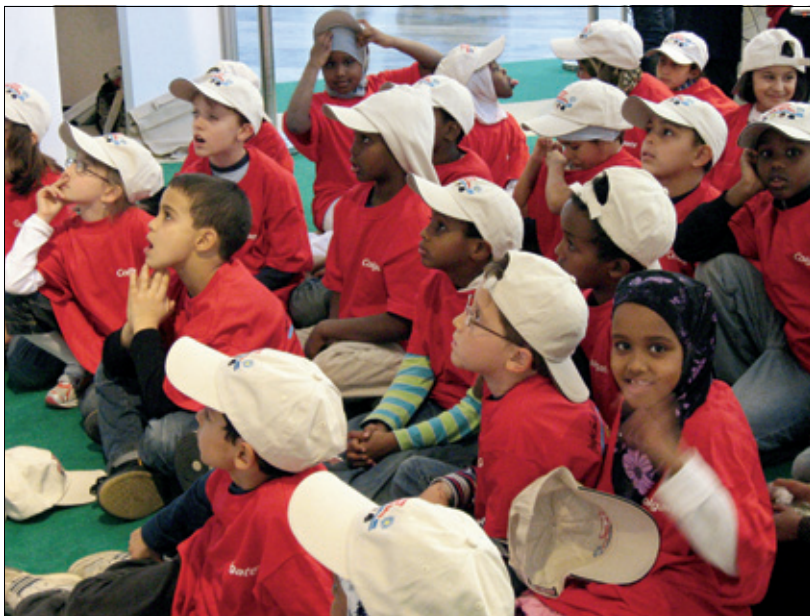
Colgates tradisjonelle barnekrok var også i år et populært og sjarmende innslag.

– Jeg kan også fortelle at de nordiske landene, sammen med Nederland og Storbritannia, hadde sine egne politiske diskusjoner under FDI-møtet i Stockholm. Norden, sammen med de to nevnte landene, fører en litt annen linje enn resten av EU når det gjelder