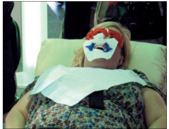
Flere benyttet sjansen til gratis bleking av tannsettet.

arbeidsfordelingen innad i tannhelse-teamet. Og det var blant annet dette vi snakket om på torsdagen under FDI, sier Gunnar Lyngstad, som ellers roser FDI's dyktige ledelse under den canadiske presidenten, Burton Conrod.