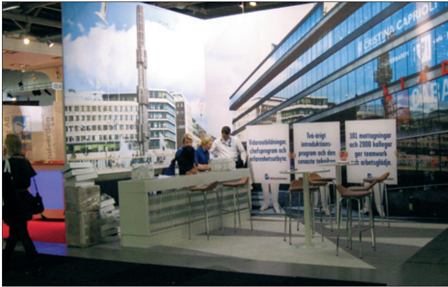
Rundt 230 utstillere fra 40 land deltok på en stor og variert, men likevel oversiktlig dentalutstilling, der elegante uniter i delikate farger dominerte bildet. Blant de mer fargerike innslagene var den lokale Folkandvården, som var meget godt representert, og som viste stor kreativitet i presentasjonen av sine respektive distrikter: fra venstre henholdsvis Norrbotten, Stockholm og Karlmar län.

– Det er lagt opp til et nytt system der medlemslandene i FDI betaler i forhold til bruttonasjonalprodukt (BNP). Dette innebærer at Norge får en betydelig kontingentøkning. I og med at Norge har så høyt BNP, blir vår medlemskontingent hele fire Euro per medlem av NTF. Dette i kontrast til 0,04 Euro per medlem, som blir prisen for dem med lavest BNP og som dermed ender opp med å betale minst. Jeg regner ikke med at vi tar noen nasjonal