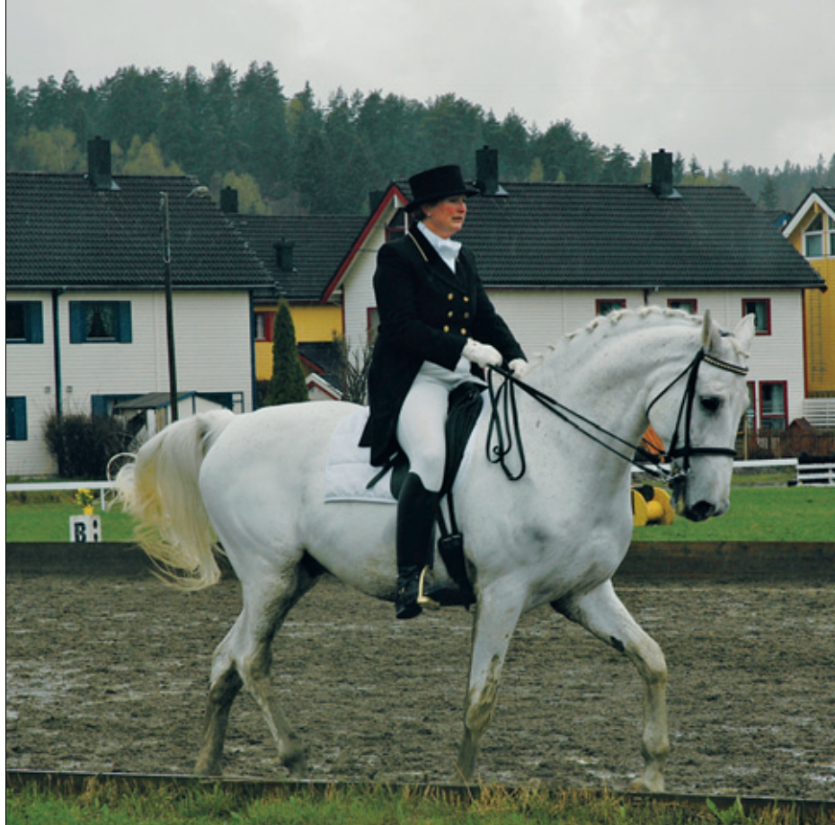
Programmet gjennomføres til punkt og prikke.

Tidende merker ikke at noen er syke. For oss virker både hest og rytter som om de er i kjempeform. Dette lover godt. Snart skal vi kjøre av gårde til