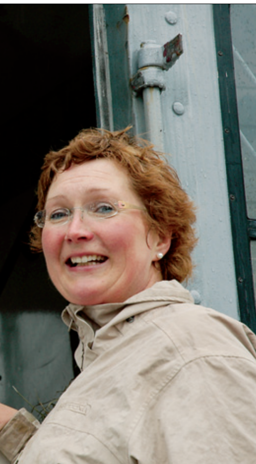
Hest og rytter er klare til avgang.