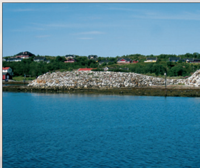
9. Steinar Breiflabb.