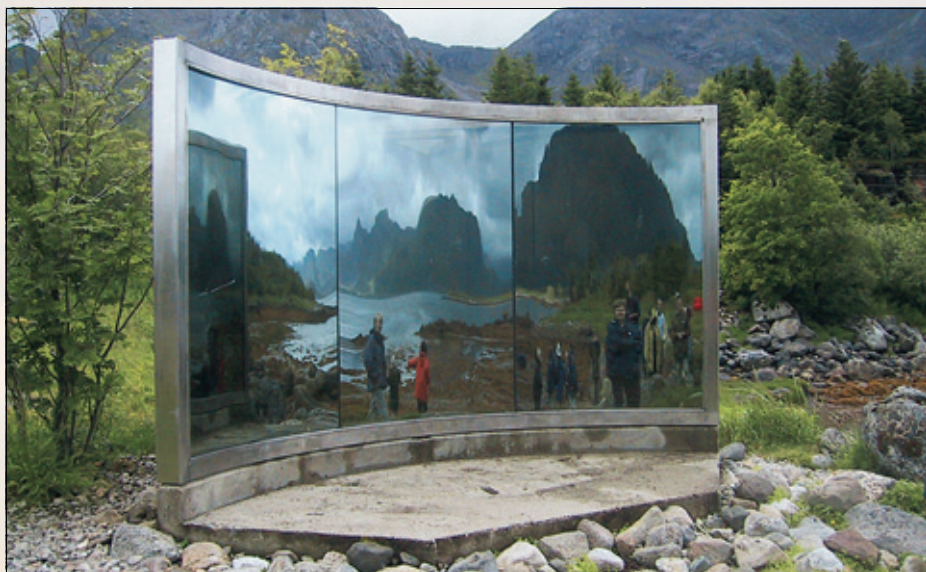
1. Begge sider samtidig

I BODØ (FOTO 2) besto skulpturen av syv store gjennomhullete granittblokker, fordelt langs moloen. De er interessante å se på, de gir assosiasjoner selv om vi ikke greier å sette ord på