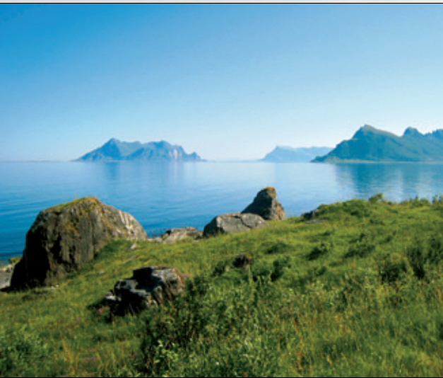
6. Bare utrolig vakkert.