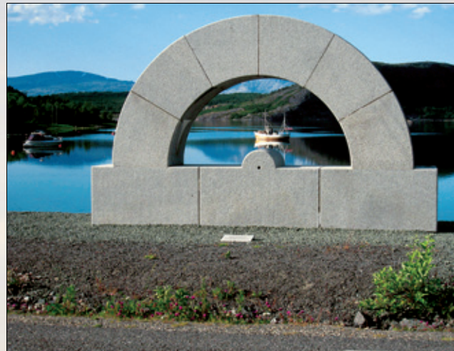
4. Transport i transportøren

de, en ski og en åre. I den fjerde lå det en stol. Skulle den være med? Nei, ifølge boken skal den være tom. Tvilen var sådd.