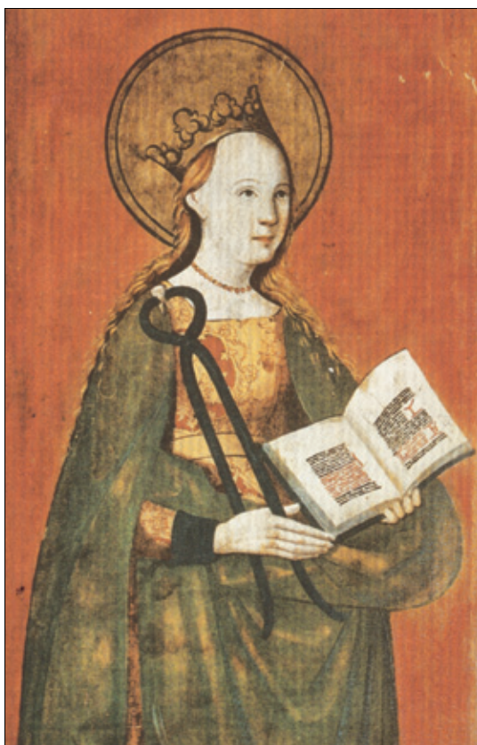
Sankta Apollonia fra Aure kirke på Nord-Møre.