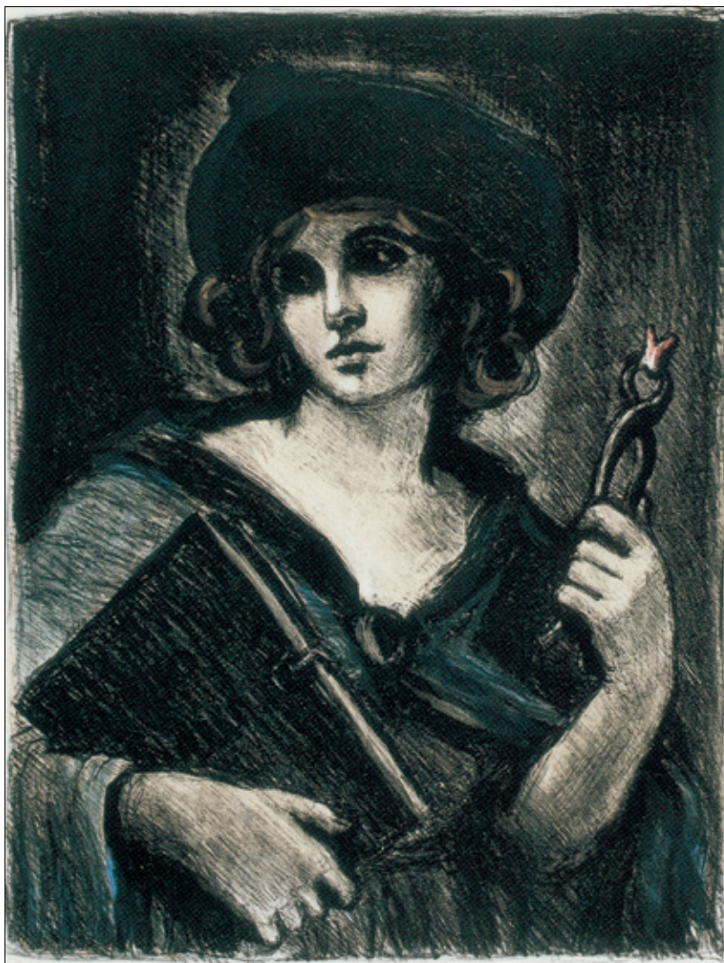
Mange tannleger har sikret seg denne vakre litografien som kunstneren Per Ung laget i forbindelse med NTFs etthundreårsjubileum i 1984.

Boken som Apollonia holder på mange bilder, er et generelt attributt som hentyder til bekjennelse av troen. En kuriositet ved Apollonias andre attributt, er at tannen, som oftest en molar, holdes i tangen i motsatt ret-