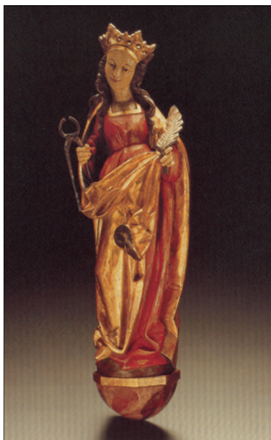
Denne treskulpturen av Sankta Apollonia er bayersk barokk fra 1700-tallet.

Det at Apollonia selv sprang inn i flammene var imidlertid en problematisk punkt i beretningen. Det fører tankene til selvmord, som hverken er forbilledlig eller hellig. I et av sine skrifter gjør derfor kirkefaderen Augustin (354–430) en tilføyelse for å legitimere hennes status som helgen.