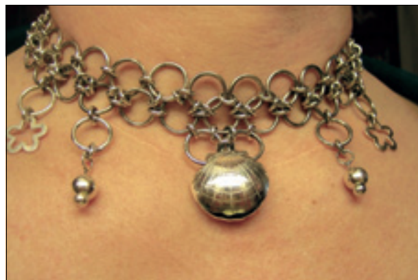
Flagstad designer alle smykkene selv. De er store og rause, og tar seg godt ut på voksne damer.