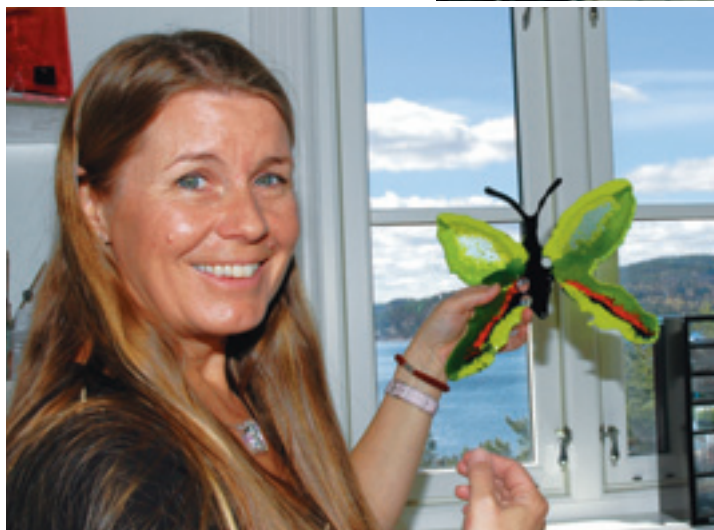
Denne sommerfuglen skal smeltes sammen med et fat.

– Jeg tenkte og trodde lenge at jeg skulle begynne med keramikk. Helt til dette plutselig en dag slo ned, nesten som et lyn. Da disse mulighetene dukket opp, ble jeg nærmest ekstatisk, og visste med det samme at det var dette jeg skulle gjøre. Jeg tok det første kurset i 2004, og etter hvert er det blitt tre kurs til. Teknikken jeg bruker mest heter