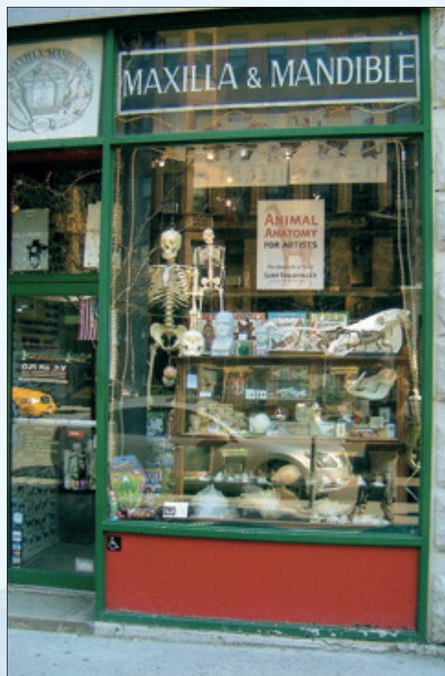
I Maxilla & Mandible får man kjøpt det meste av modeller og preparater innen anatomi, naturhistorie og naturvitenskap.

Er osteologi ditt fag, kan du kjøpe skjeletter og modeller av kroppens ben. Hva med et gevir av steinbukk eller afrikansk gnu til å henge på hytta? Eller skalle av bever, apekatt eller vas-