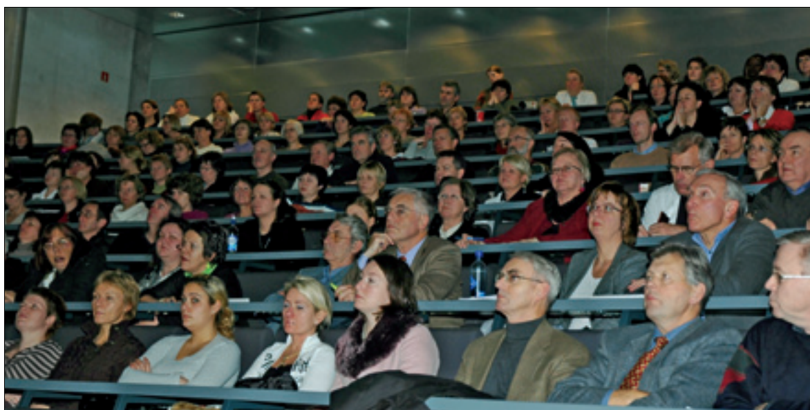
Et fullsatt auditorium lytter til erfaringene fra Göteborg og København.