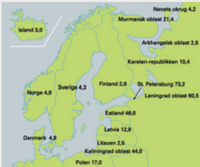
Figur 1. Meldte hivtilfeller per 100 000 innbyggere i 2005 for regioner og land i Barentsregionen og området rundt Østersjøen (3). For Polen data for 2004.

land og Russland er i motsetning til dataene fra de nordiske landene ikke så detaljert med henblikk på å kartlegge smittemåter, med unntak av injiserende misbruk som vanligvis diagnostiseres ved behandlingstilstander o.l. Overvåking av smittsomme sykdommer i Russland og de baltiske land har lange tradisjoner. I tidligere Sovjetunionen var det ulike overvåkingssystemer for smittsomme sykdommer blant militærpersonell, utlendinger, fengselsinnsatte og befolkningen ellers. I de baltiske landene har man etter hvert utviklet ett overvåkingssystem som omfatter hele befolkningen, men hivdata rapportert fra Nordvest-Russland vil i mange områder fremdeles ikke inkludere hivtilfeller diagnostisert hos militærpersonell eller innsatte i fengsler.