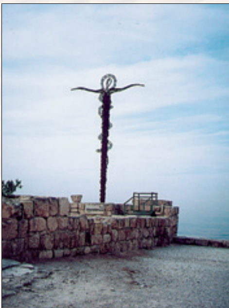
Et digert bronsekors med slangen som Moses tok opp, på Nebofjellet.

frukt og grønnsaker kan man kjøpe på hvert gatehjørne. Jeg foretrekker dette fremfor hotellrestaurantene med vestlig tilpassede menyer og smiskende kelnere. Og så har jeg jo et lønnlig håp om en gratis slankekur når gatefloraen