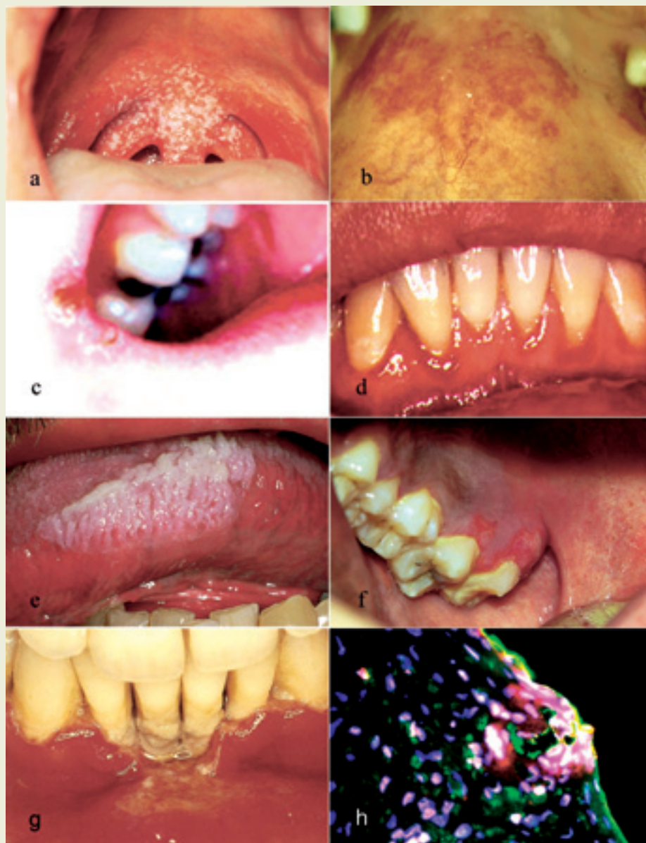
Figur 1. Noen orale manifestasjoner ved HIV-infeksjon: Pseudomembranøs candidiasis (a), erytematøs candidiasis (b), angulær cheilitt (c), lineært gingivalt erytem (d), hårete leukoplaki (e), sekundær residiverende herpes simplex (f), nekrotiserende og ulcererende gingivitt (NUG) (g), og ekspresjon av det antifungale proteinet kalprotektin (grønt) i oralt gingivalt epitel og nøytrofile granulocytter (rødt). Cellekjerner er farget blått, og hvite områder (rødt, grønt og blått) indikerer kalprotektin produserende nøytrofile granulocytter (h). Figur 1h er gjengitt med tillatelse fra Myint og medarbeidere (20) og tidsskriftet AIDS.

Herpes simplex-virus forårsaker både primære og sekundære residiverende infeksjoner i munnhulen (Figur 1f). Primær herpetisk gingivostomatitt opptrer hyppigst hos barn og unge voksne. Etter primærinfeksjonen blir viruset liggende latent i ganglion trigeminale. Residiverende infeksjon opptrer i alle aldersgrupper både ekstra- og intraoralt. Residiverende herpes labialis opptrer som små vesikler