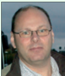
Lars Björkman Professor, Bergen

Bivirkningsgruppen for odontologiske biomaterialer utreder pasienter med mistenkte bivirkninger av odontologiske biomaterialer, forestår rapportering av bivirkninger og driver forskning og utvikling innen området. Foredraget kommer å ta opp erfaringer av bivirkningsrapporteringen samt erfaringer fra klinisk utredning og oppfølging av pasienter som har blitt utredde ved Bivirkningsgruppen. Foredraget kommer også å ta opp anbefalinger om utredning av pasienter med mistenkte bivirkninger av odontologiske biomaterialer.